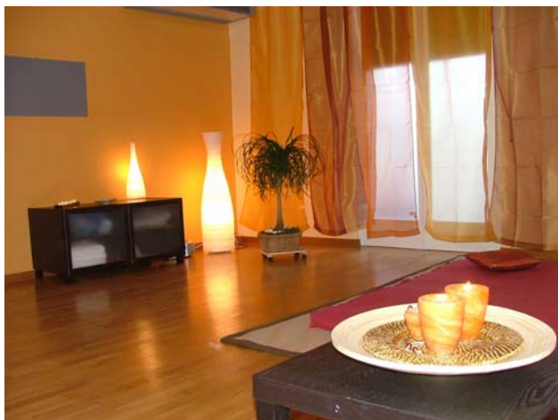
AREA EQUA - SALA ENERGY